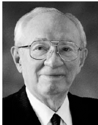
President Gordon B. Hinckley

Han och hans hustru, Marjorie Pay Hinckley, som dog nyligen, har fem barn och många barnbarn.